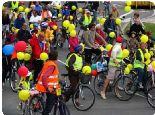
La Ville à Vélo - Granville

Quand on se déplace habituellement à vélo, on ne peut plus s'en passer. On part même en vacances avec.