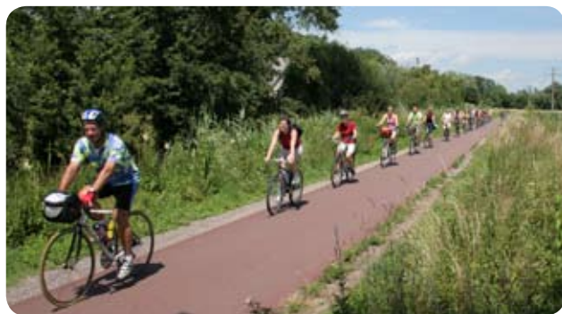
Canal de la Bruche à Achenheim

Arrivée à la gare de Haguenau à 9h24 et petit tour de ville.