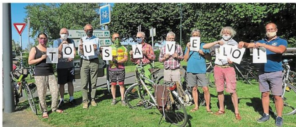
« Tous en selle, tous à vélo ! », c'est le nouveau slogan des Dérailleurs.