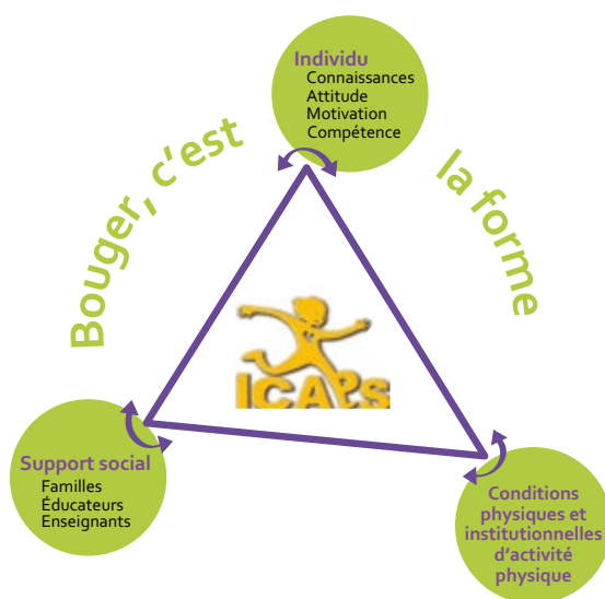
Niveaux d'intervention d'Icaps d'après International Journal of Obesity (2004)

Une intervention a toutes les chances d'être plus efficace si elle s'inscrit d'emblée dans une approche socio-écologique intégrant plusieurs niveaux et types d'actions :